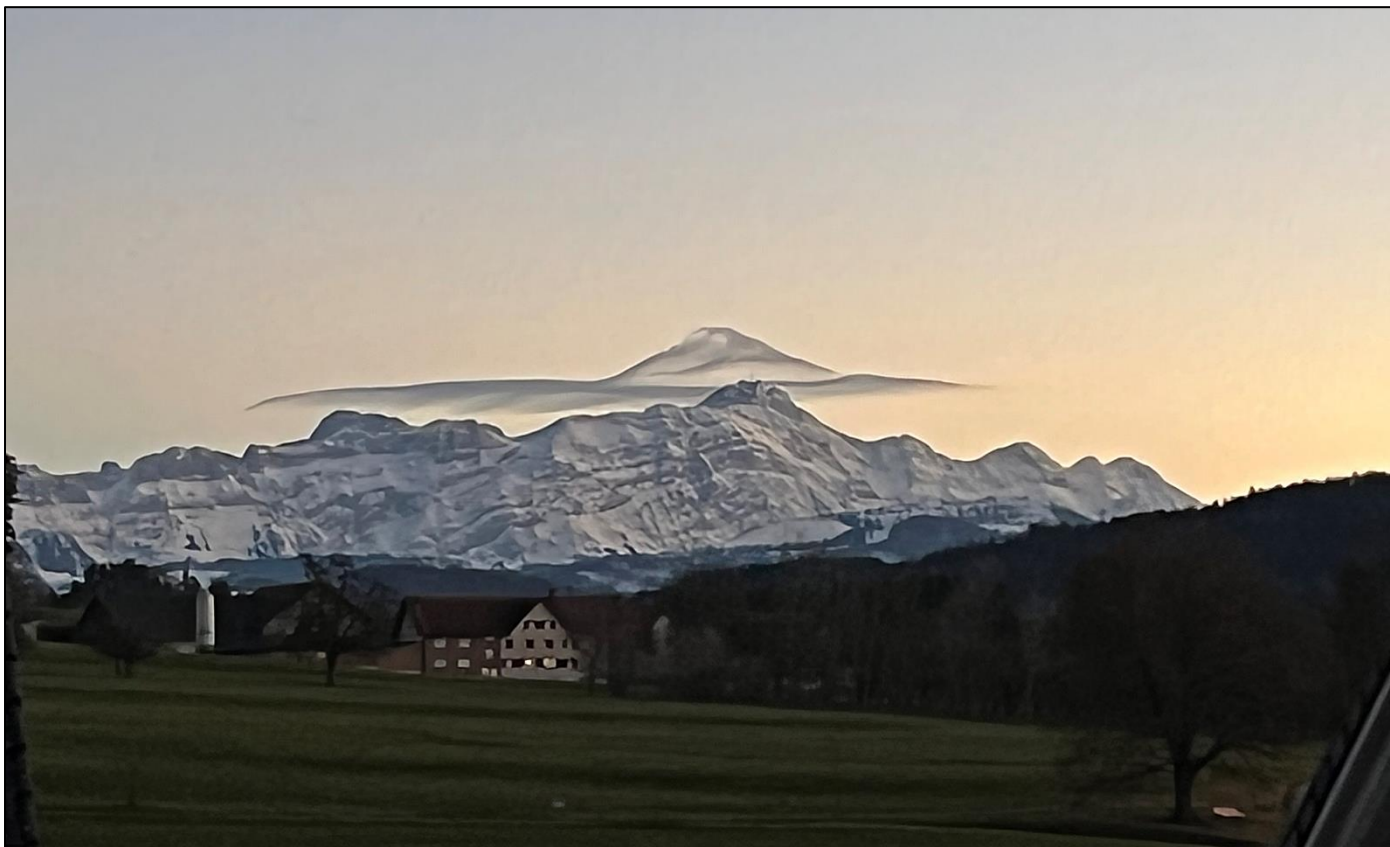
Eine spezielle Aufnahme vom Säntis mit Wolken-Doppel im Hintergrund.